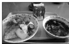
給食の人気メニュー「ジャンボ餃子」(学校訪問にて)