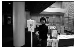
岩手県盛岡市で行われた日本自治学会