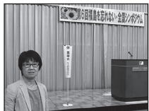
↑「福島を忘れない!」全国シンポジウム」現地視察(7月15日・16日)