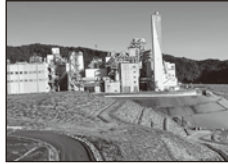
↑国分寺市議会として、ゴミの最終処分場の視察に行きました。(10月31日)