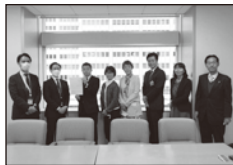
↑東京都に「国分寺市労働会館の今後の活用についての要望書」を会派の皆さんと提出しました。(11月1日)