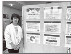
↑並木公民館で開催された「多様な性を知ろう」パネル展に行って来ました。(5月31日)